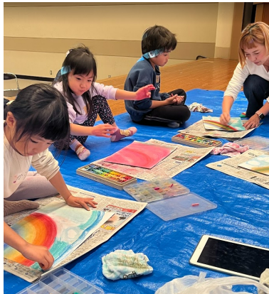
午後のはなちゃんにお絵描きを教えてもらう子どもたち