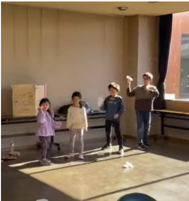
午前シッターさんたちと遊ぶ子供たち