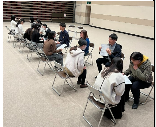
育Qひろば×谷口ゼミの学生さんでトークフォークダンス

昨年からの改善点で、参加、対話型のイベントにし、連携する名市大の学生さんにも参加いただきました。育Qひろばの持つ雰囲気、参加者のやさしさのおかげでNPO育QひろばのMVVをそのまま具現化したイベントになった。みんなが笑顔で過ごせて、笑顔で終われたイベント。来年もやる！