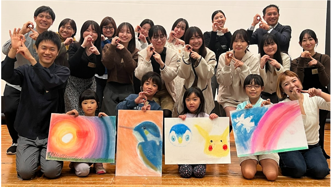
育Qひろばwith子ども達×名市大谷口ゼミメンバー 育Qひろばポーズで集合写真

昨年第一回開催となった両立万博の2年目。11/24(日)去年と同じイーブル名古屋とオンラインのハイブリッド開催。事務局定例 隔週水曜21時30分～。 今年の開催テーマ決定！【パーツモデルで考える両立術】